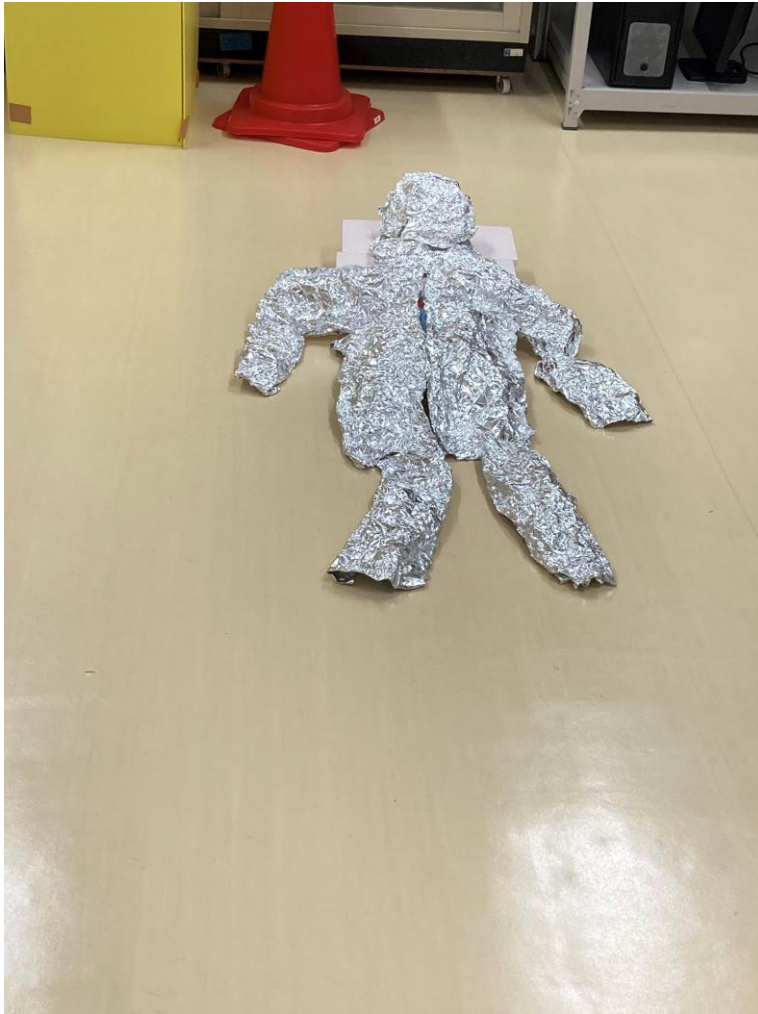
アルミホイルの人体モデル